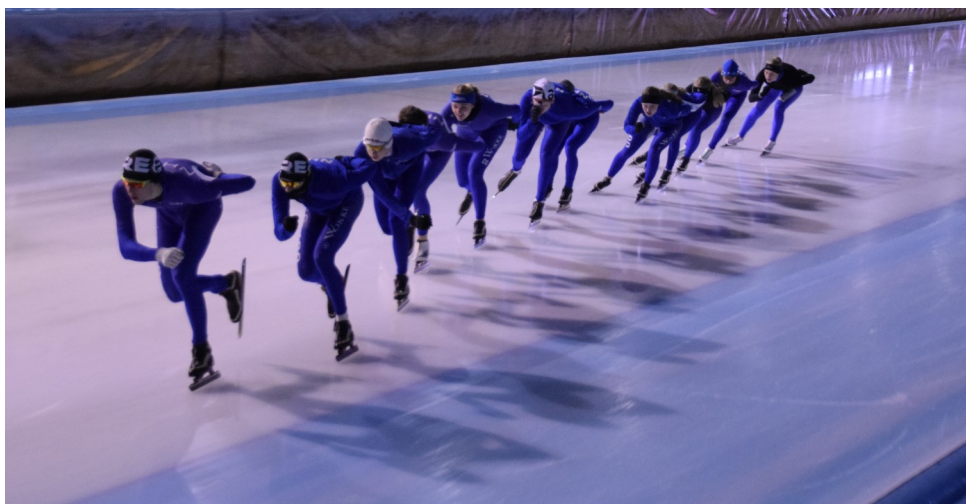
De schaatsers van de Baanselectie Hoorn-Alkmaar in actie.